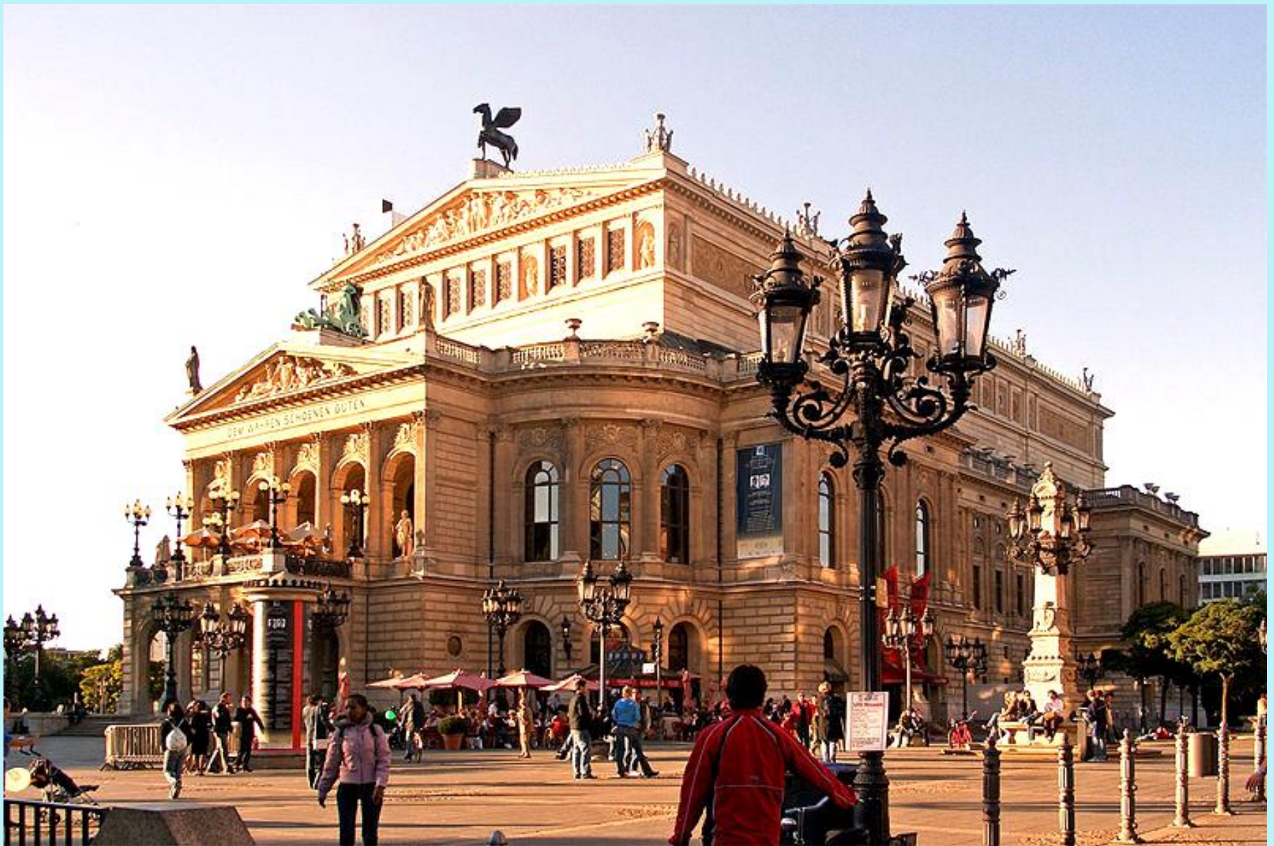
Die Alte Oper