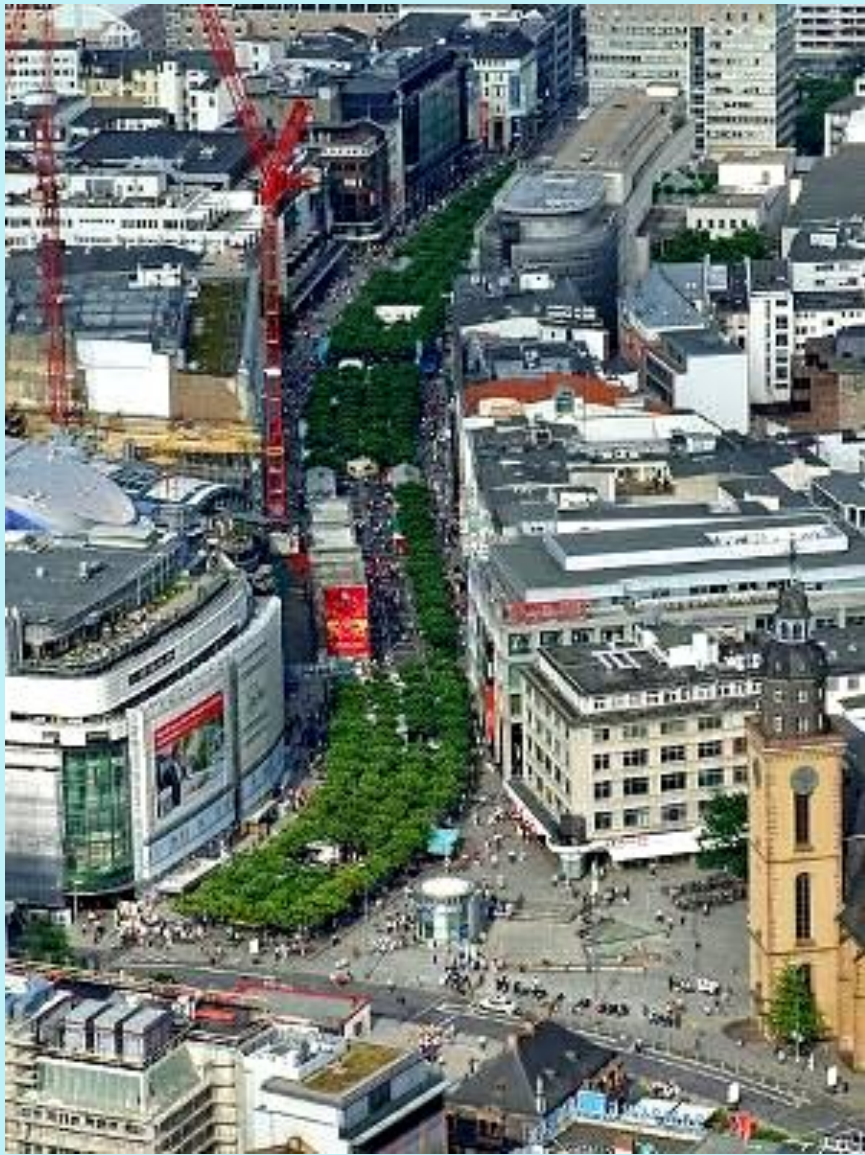
Straße Zeil - Einkaufstraße von Frankfurt