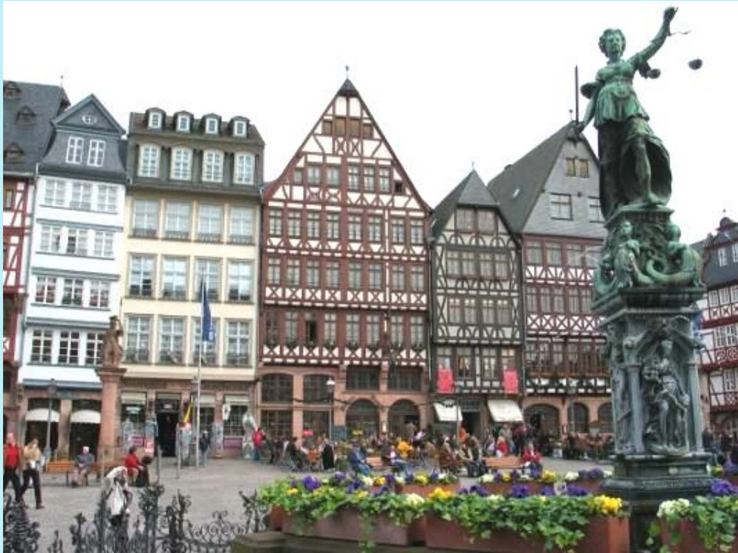
Der Gerechtigkeitsbrunnen vor dem Römer