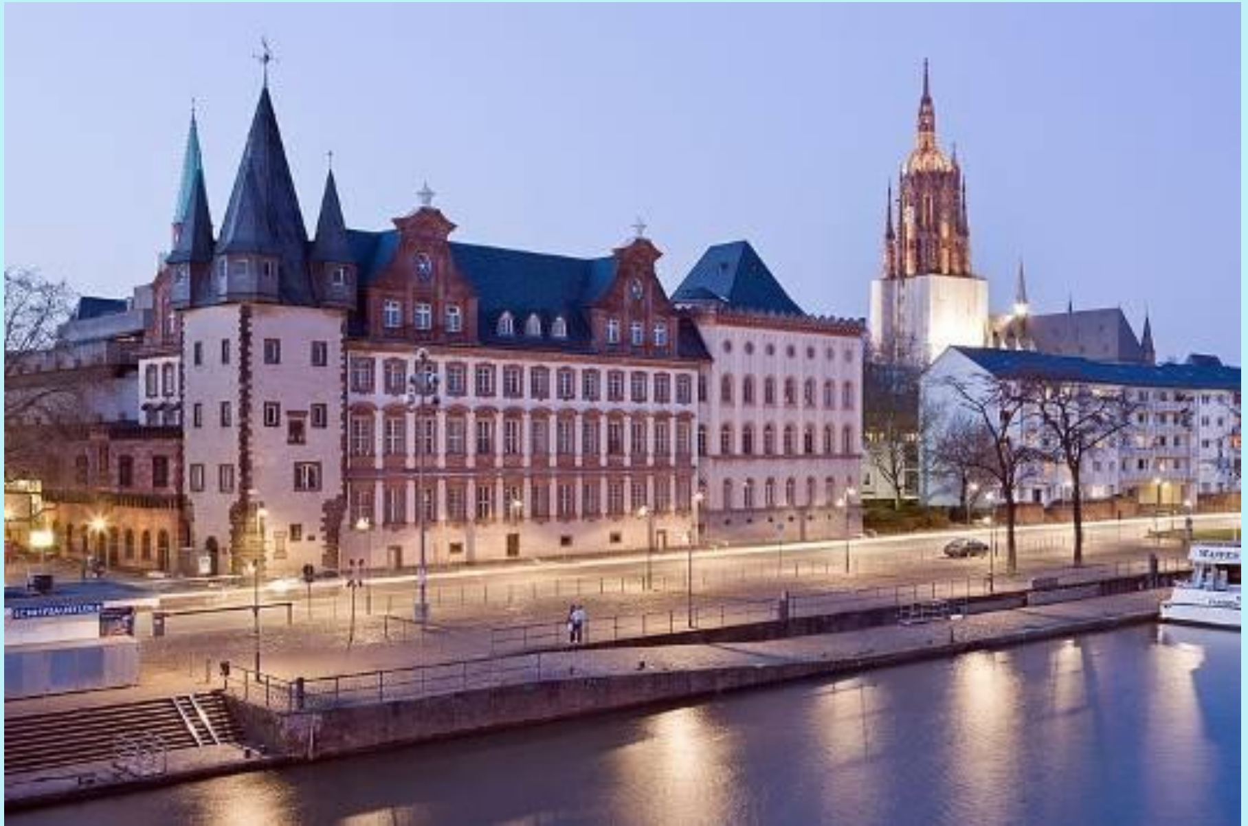
Das Historische Museum