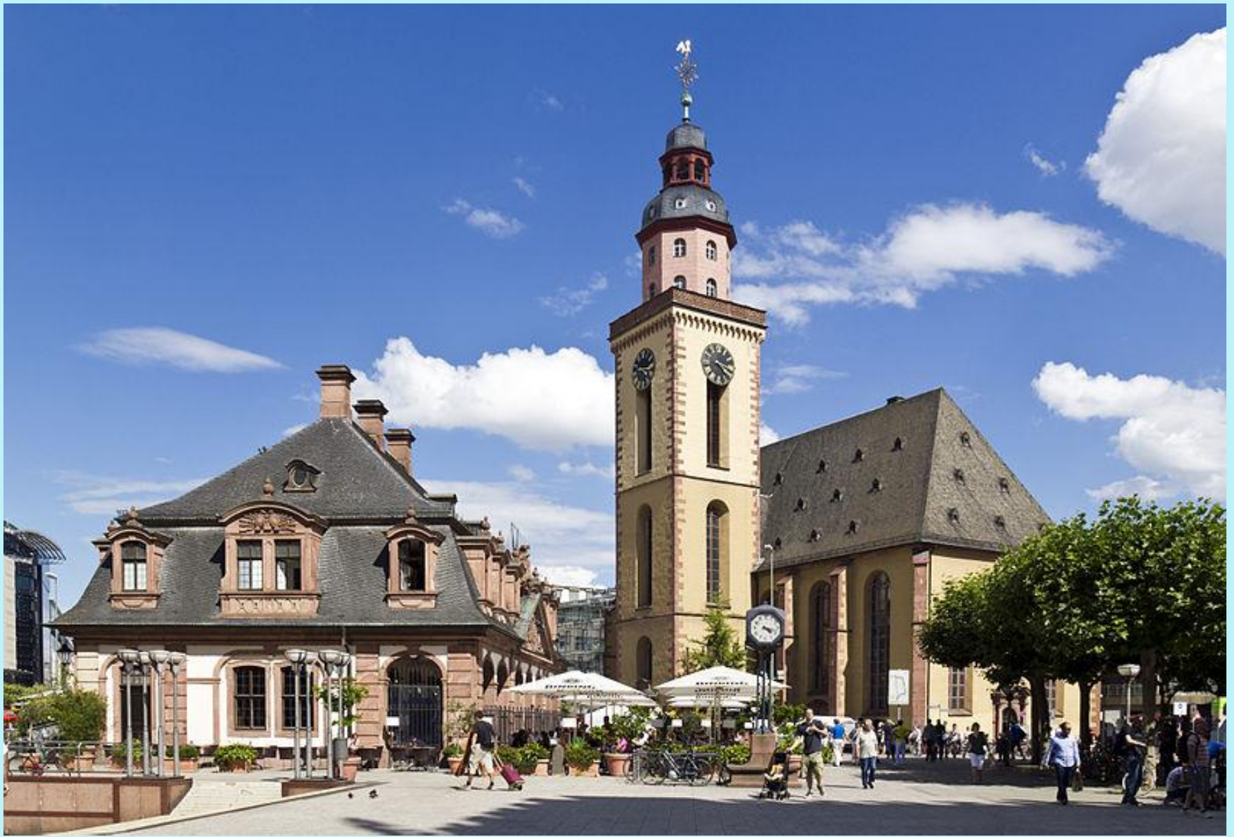
Hauptwache und St. Katharinenkirche