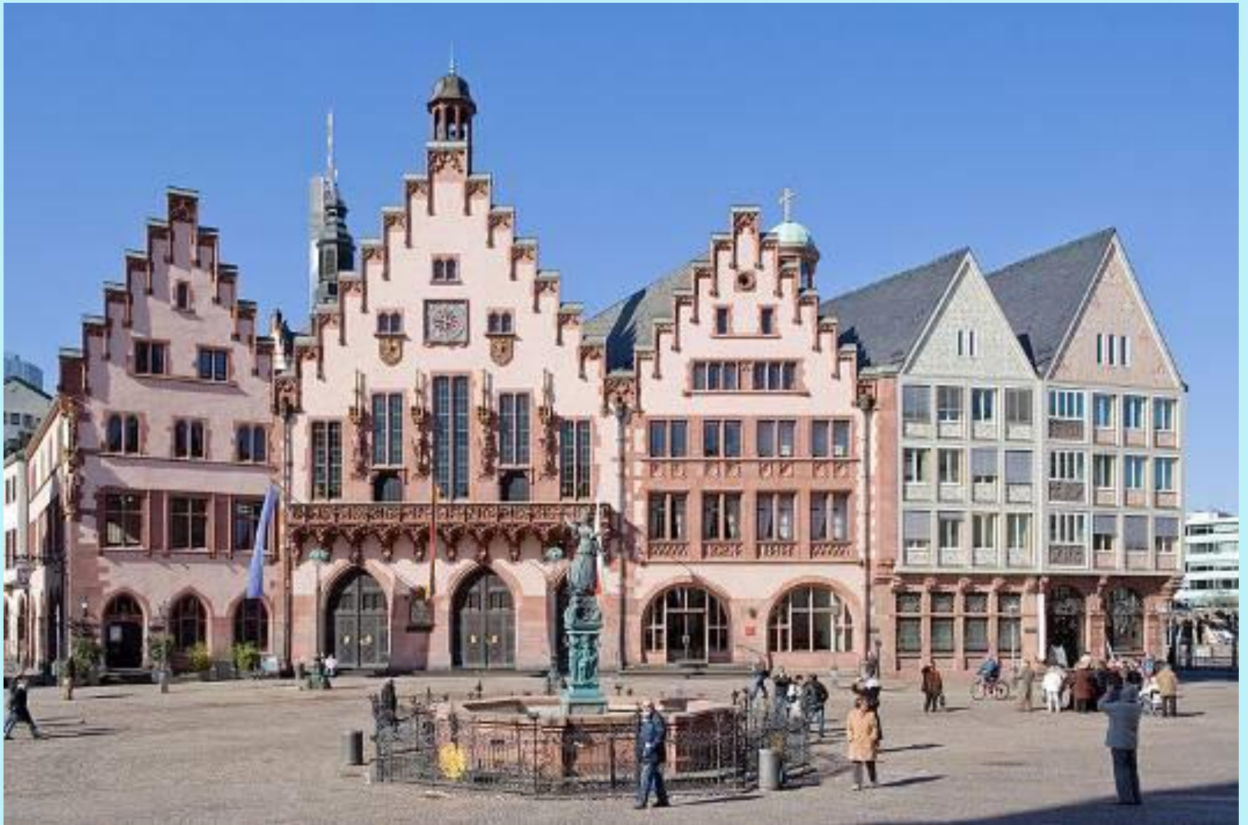
Der Römer – das Frankfurter Rathaus