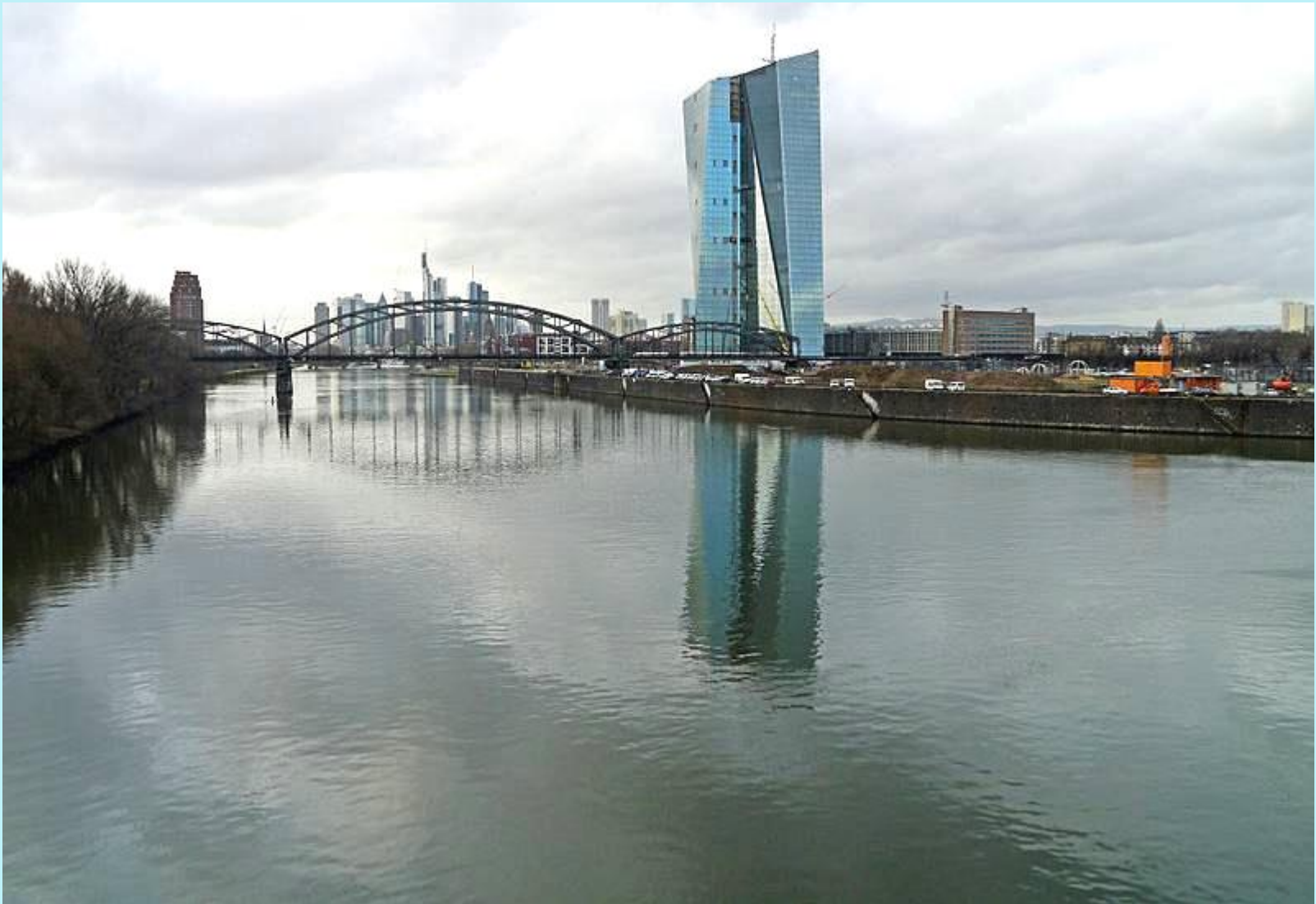
Mainpanorama mit EZB – mit Europäischer Zentralbank