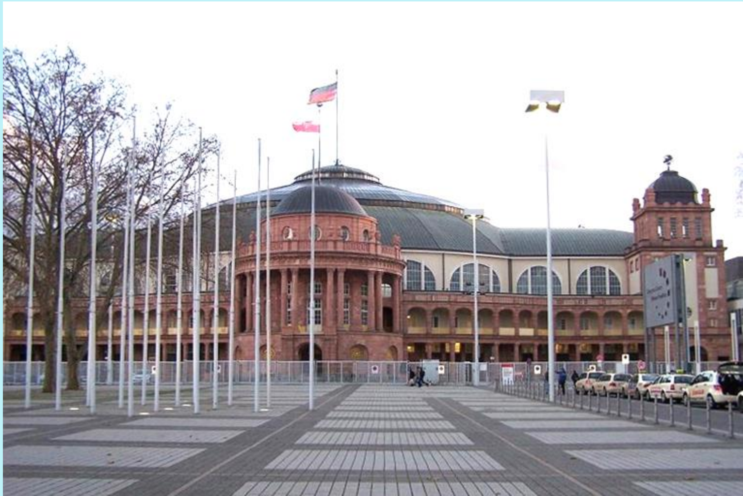
Festhalle auf dem Messegelände