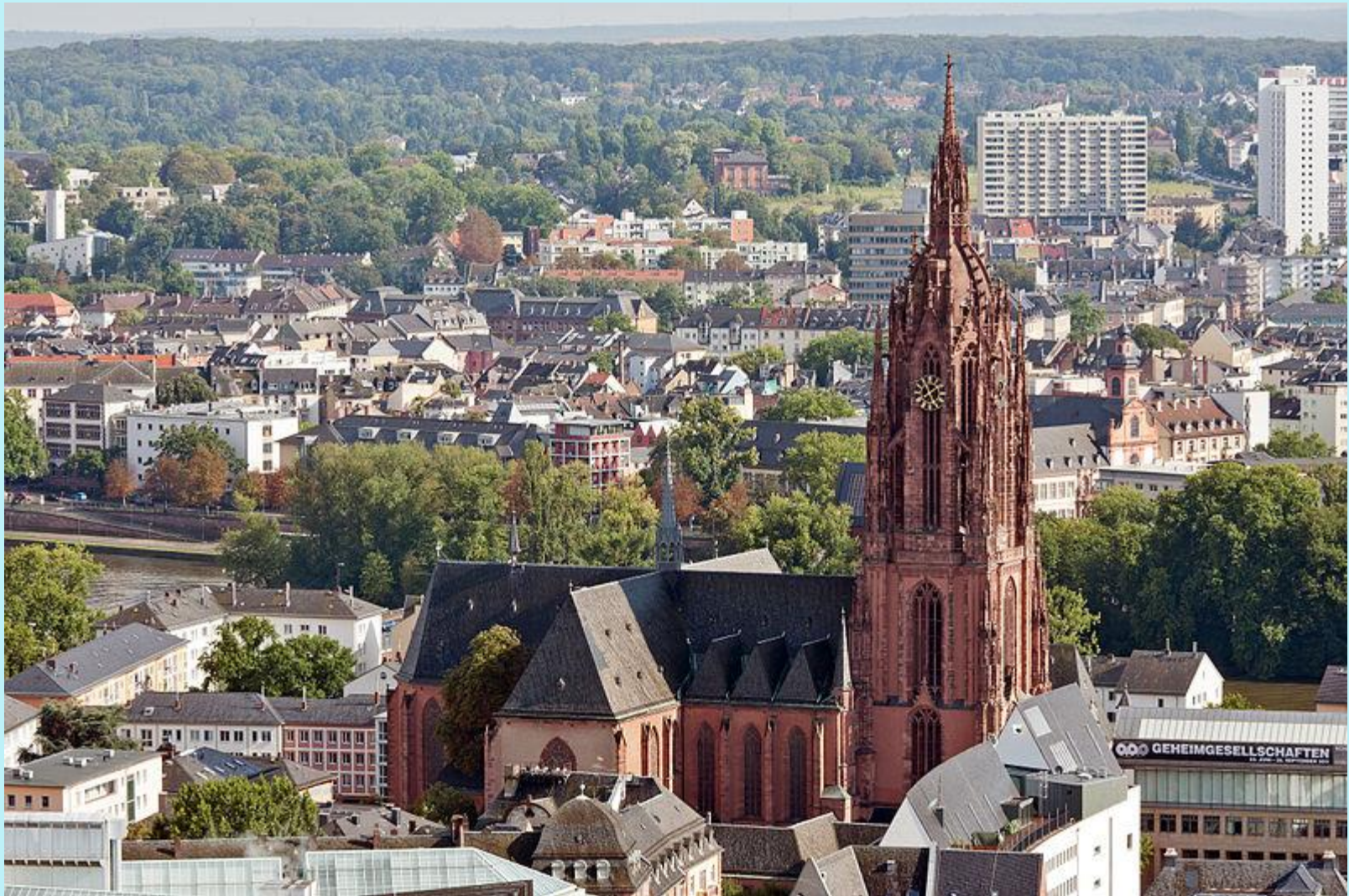
Der Kaiserdom St. Bartholomäus – die größte Kirche der Stadt