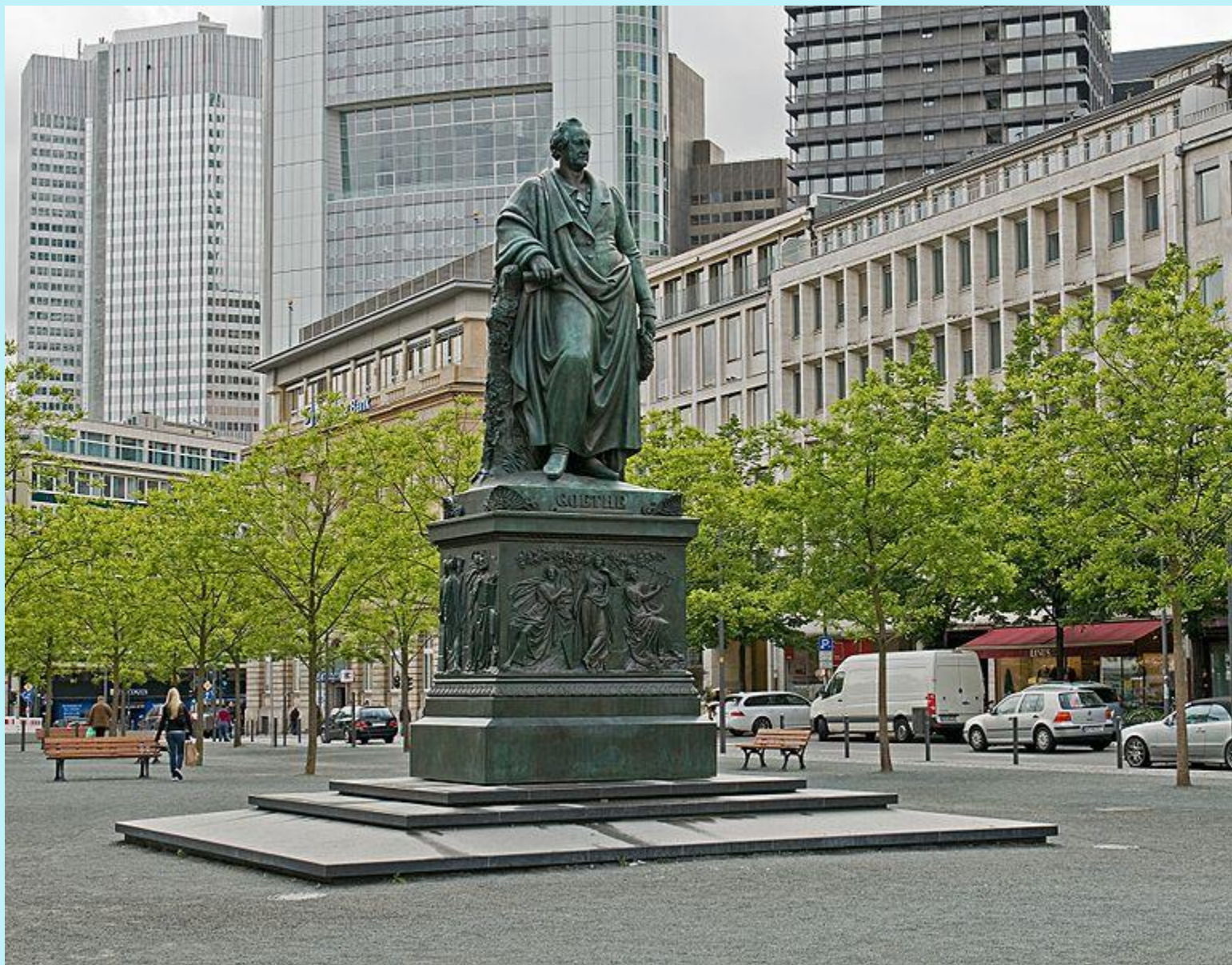
Das Goethedenkmal auf dem Goetheplatz