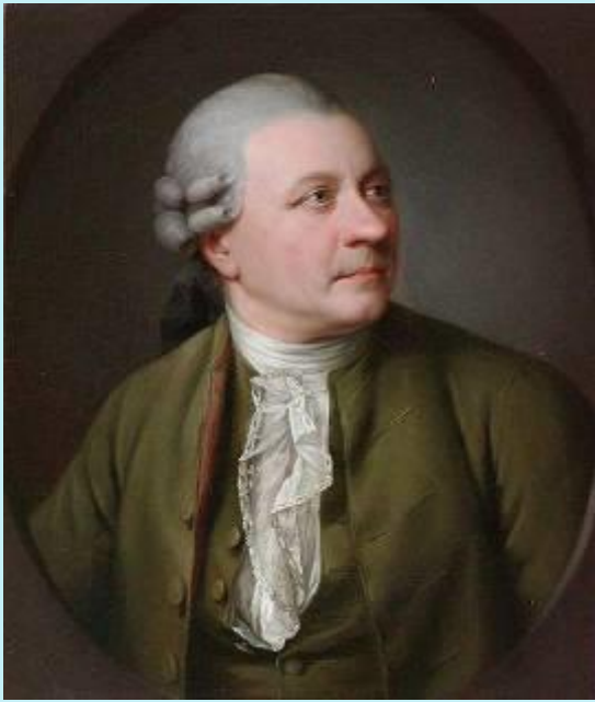
Friedrich Gottlieb Klopstock (* 2. Juli 1724 in Quedlinburg; † 14. März 1803 in Hamburg) Gemälde von Jens Juel, 1779