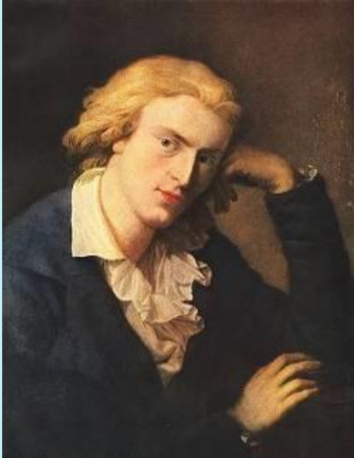
Johann Christoph Friedrich von Schiller (* 10. November 1759 in Marbach am Neckar, Württemberg; † 9. Mai 1805 in Weimar, Sachsen-Weimar), Gemälde von Anton Graff, 1791