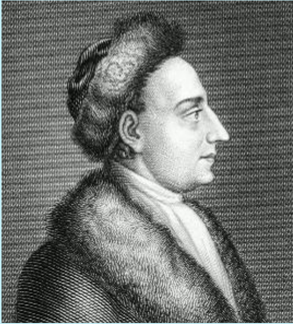
Heinrich Wilhelm von Gerstenberg (* 3. Januar 1737 in Tondern, Schleswig; † 1. November 1823 in Altona)