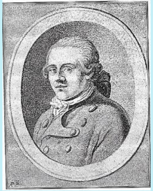
Jakob Michael Reinhold Lenz (* 23. Januar 1751 in Seßwegen, Livland - † 4. Juni 1792 in Moskau)