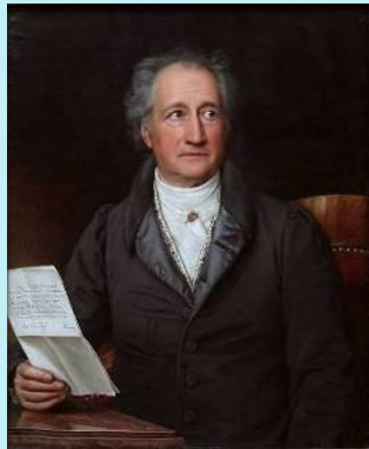
Johann Wolfgang von Goethe , geadelt 1782 (* 28. August 1749 in Frankfurt am Main; † 22. März 1832 in Weimar) Gemälde von Joseph Karl Stieler, 1828