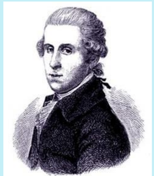
Johann Anton Leisewitz (* 9. Mai 1752 in Hannover; † 10. September 1806 in Braunschweig)