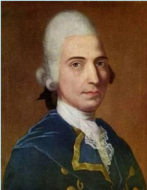
Gottfried August Bürger (* 31. Dezember 1747 in Molmerswende; † 8. Juni 1794 in Göttingen) Gemälde von Johann Heinrich Tischbein, 1771