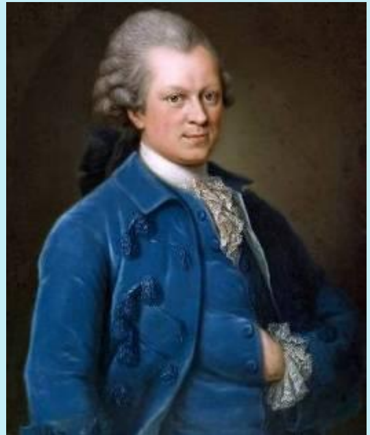
Gotthold Ephraim Lessing (* 22. Januar 1729 in Kamenz, Markgraftum Oberlausitz; † 15. Februar 1781 in Braunschweig) Gemälde von Anna Rosina de Gasc, 1767/1768