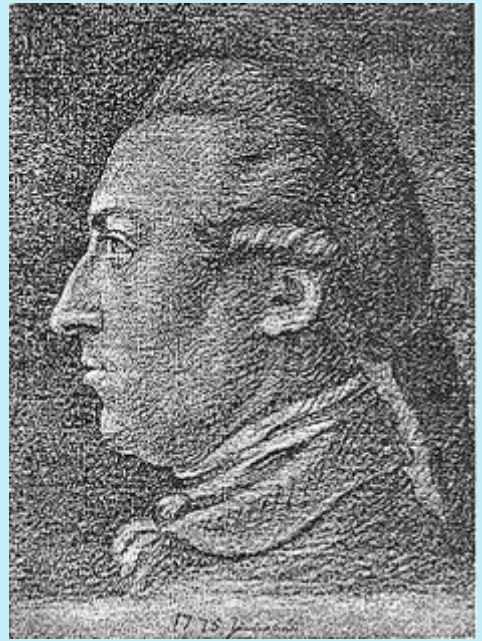
Friedrich Maximilian von Klinger (* 17. Februar 1752 in Frankfurt am Main; † 9. März 1831 in Dorpat, Estland) Kreidezeichnung von J.W. Goethe, 1775