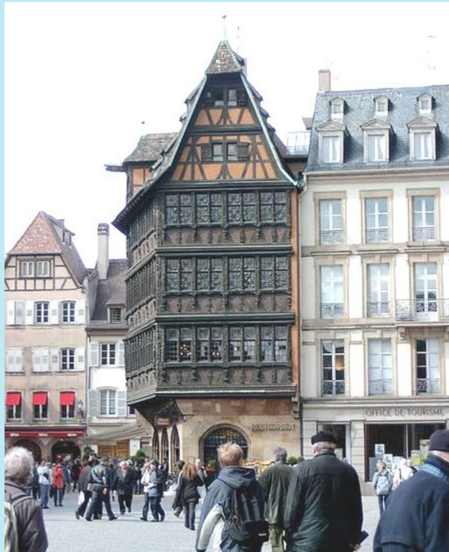
Kammerzellsches Haus am Münsterplatz