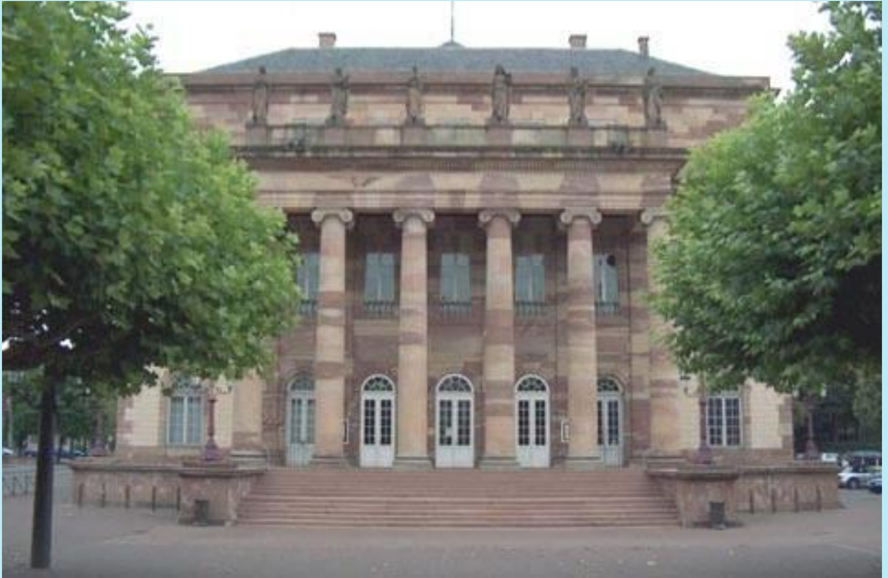
Straßburger Opernhaus - Nationale Rheinoper