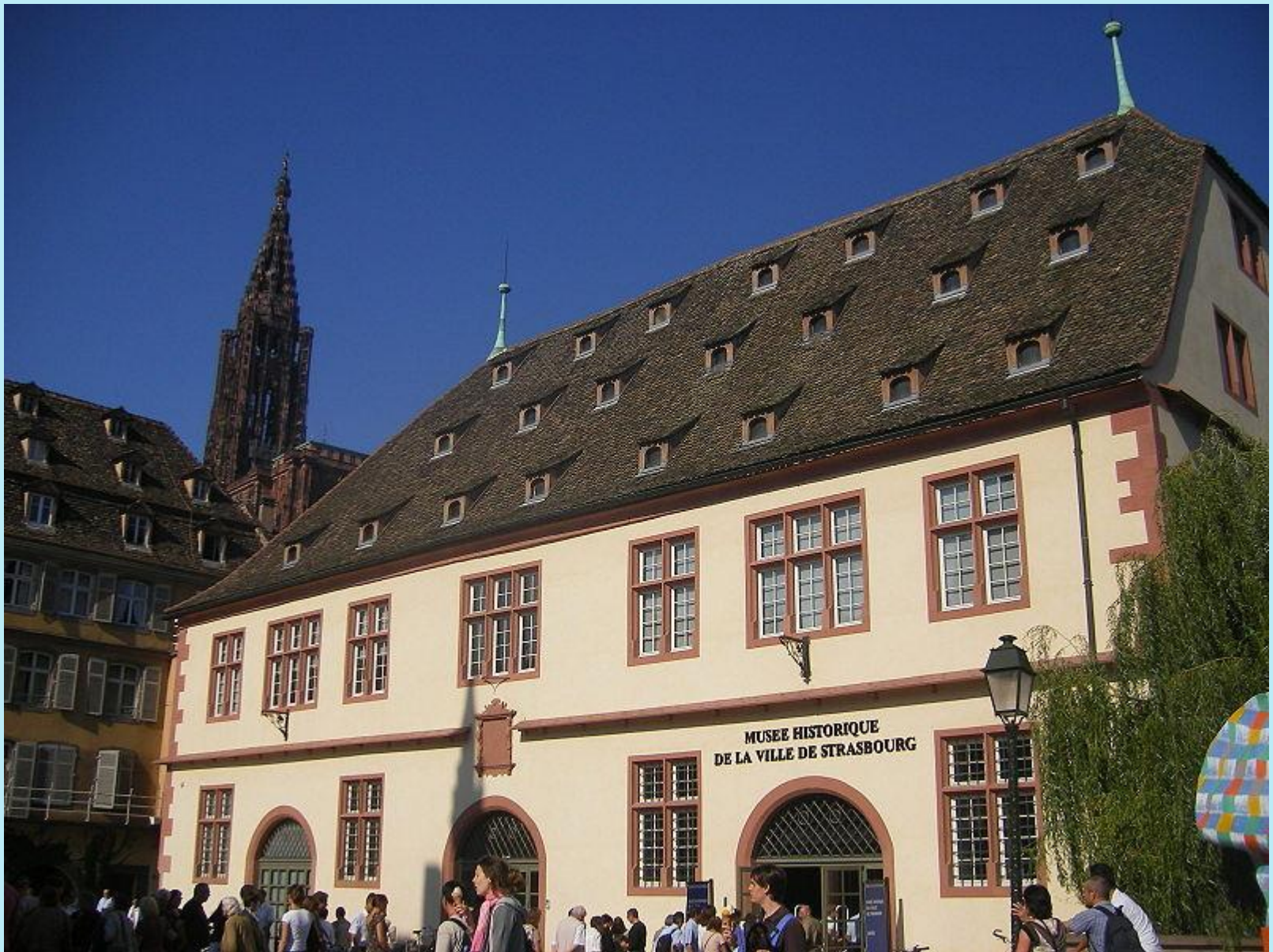
Historisches Museum in der „Großen Metzsig“