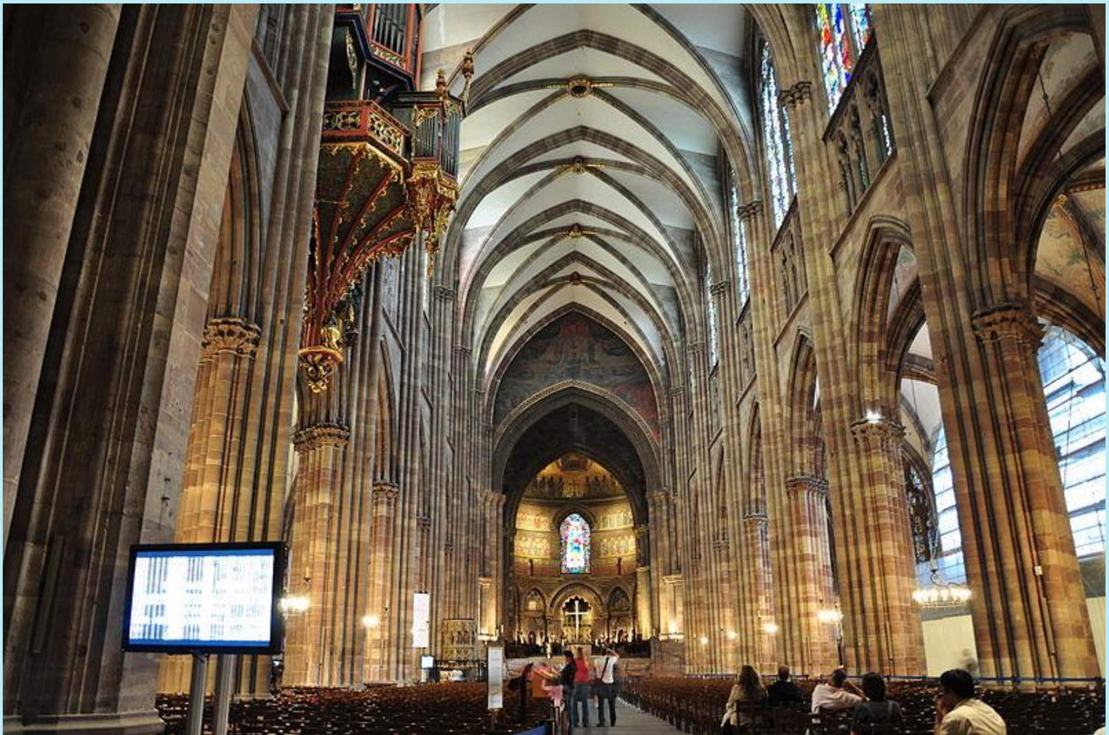
Straßburger Münster. Innenraum