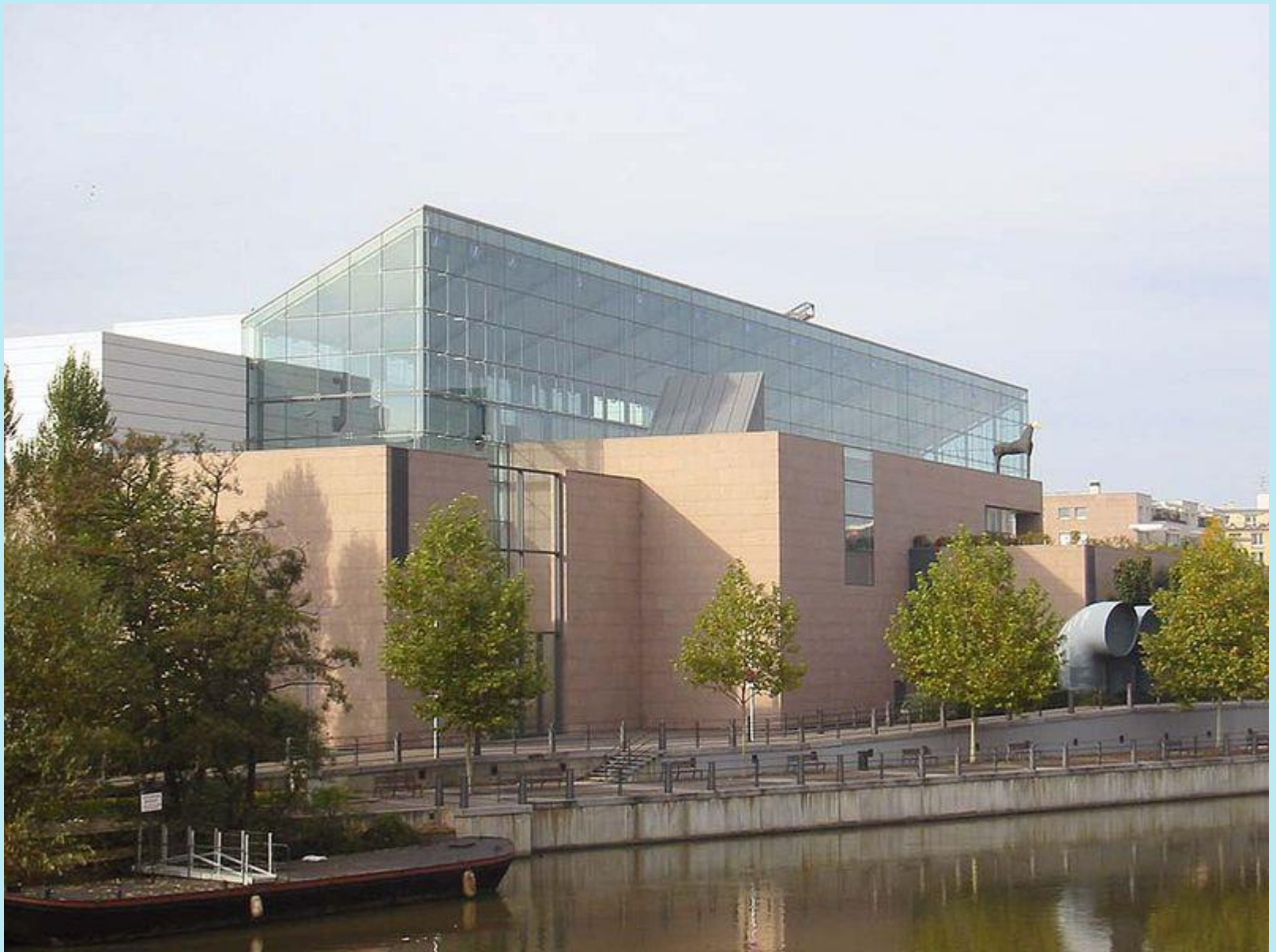
Museum der modernen Kunst