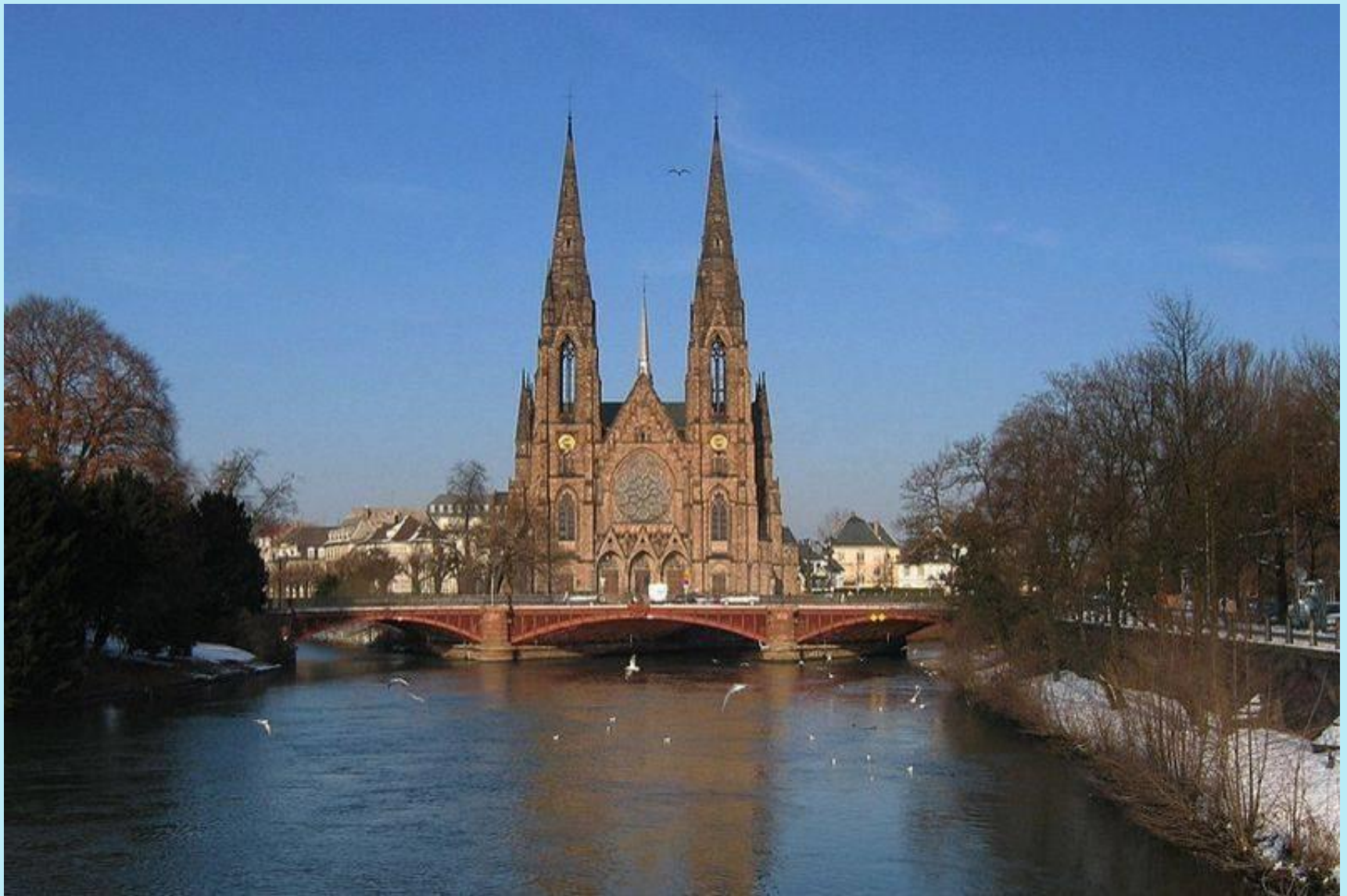
Sankt-Paul-Kirche an der III