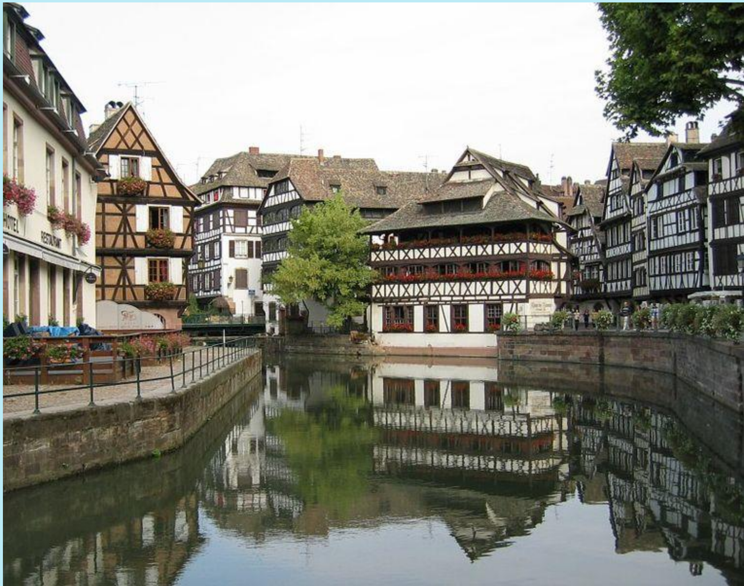
Gerberviertel „Petite France“ – „Kleines Frankreich“