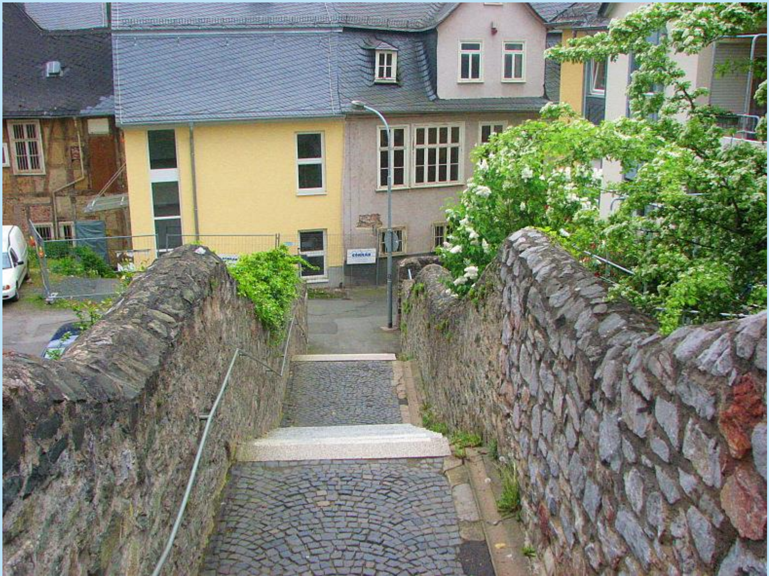
Ein alter Weg in Wetzlar