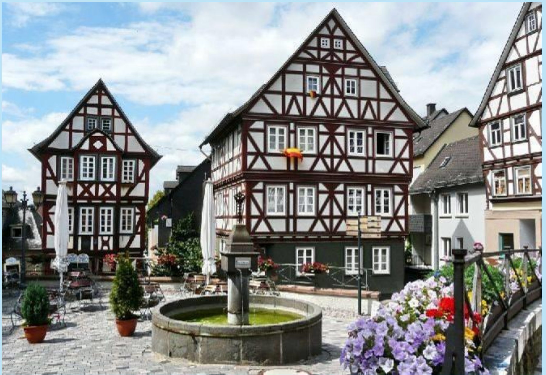
Kornmarkt / Kornplatz