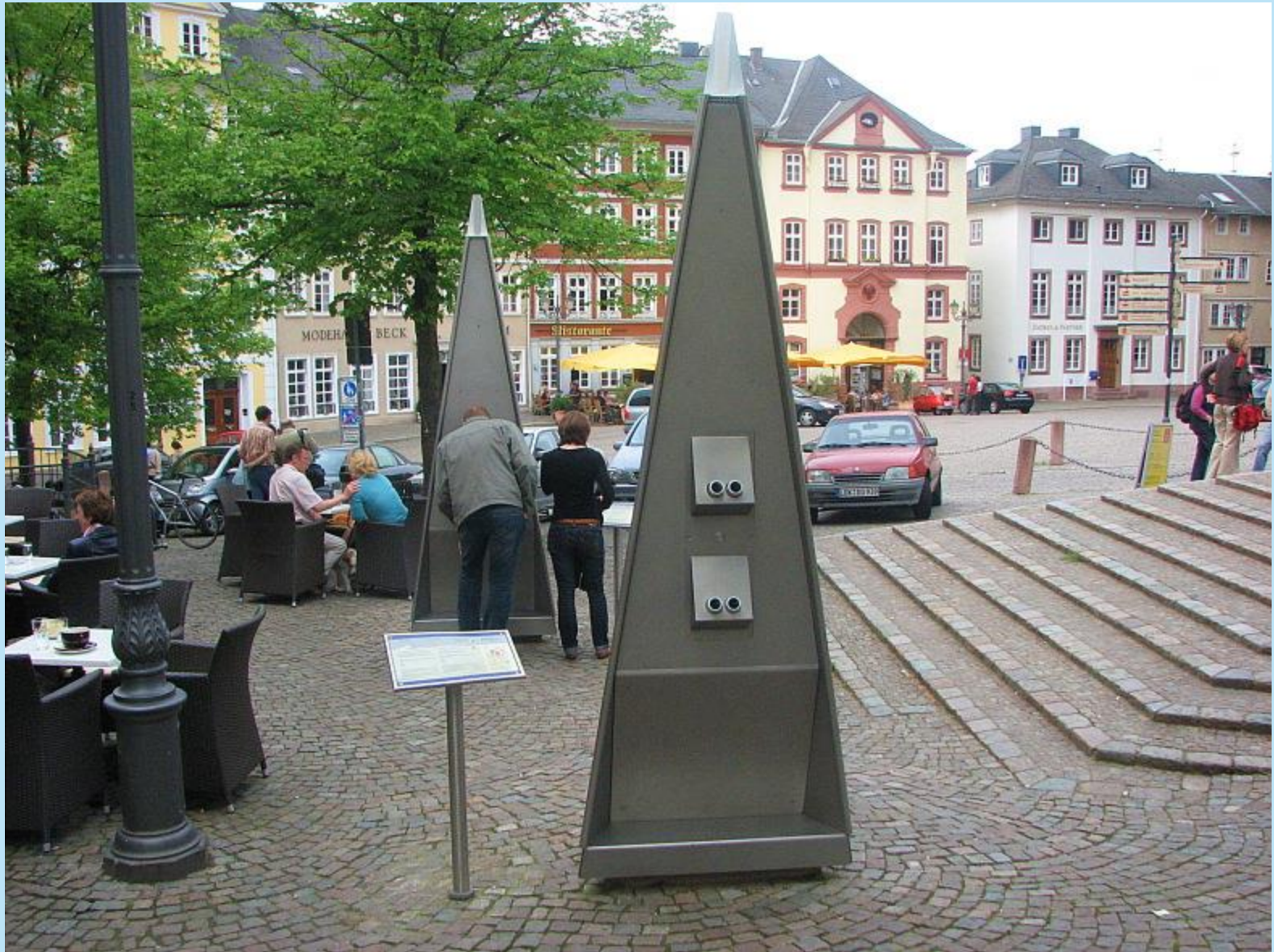
Optische Geräte für alle