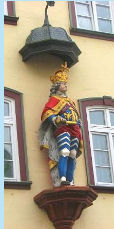
Kornplatz, Gasthaus „Zum Römischen Kaiser“