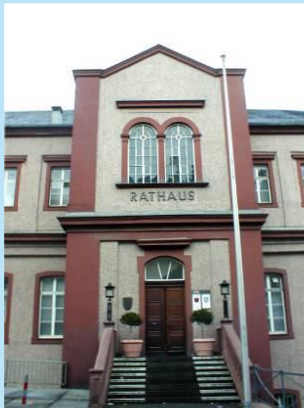
Hausergasse. Das neue Rathaus