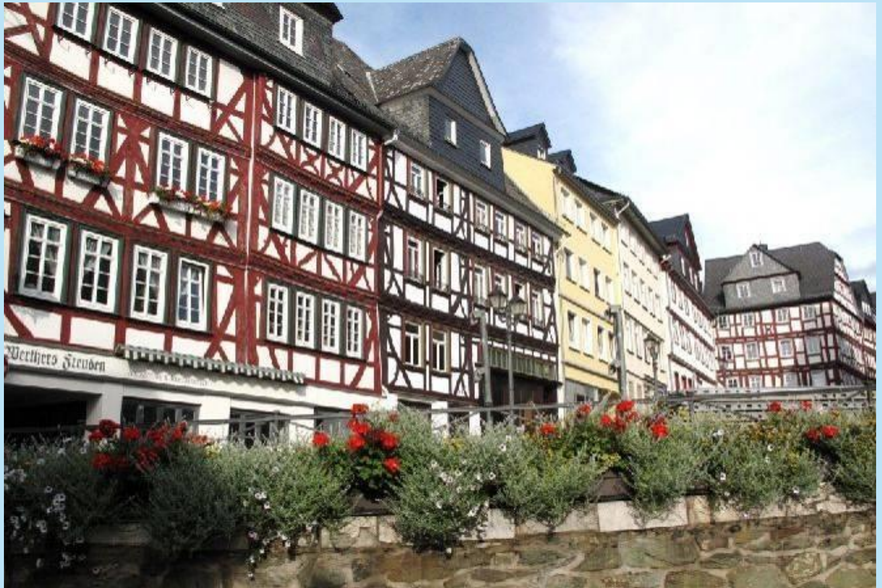
Kornmarkt / Kornplatz