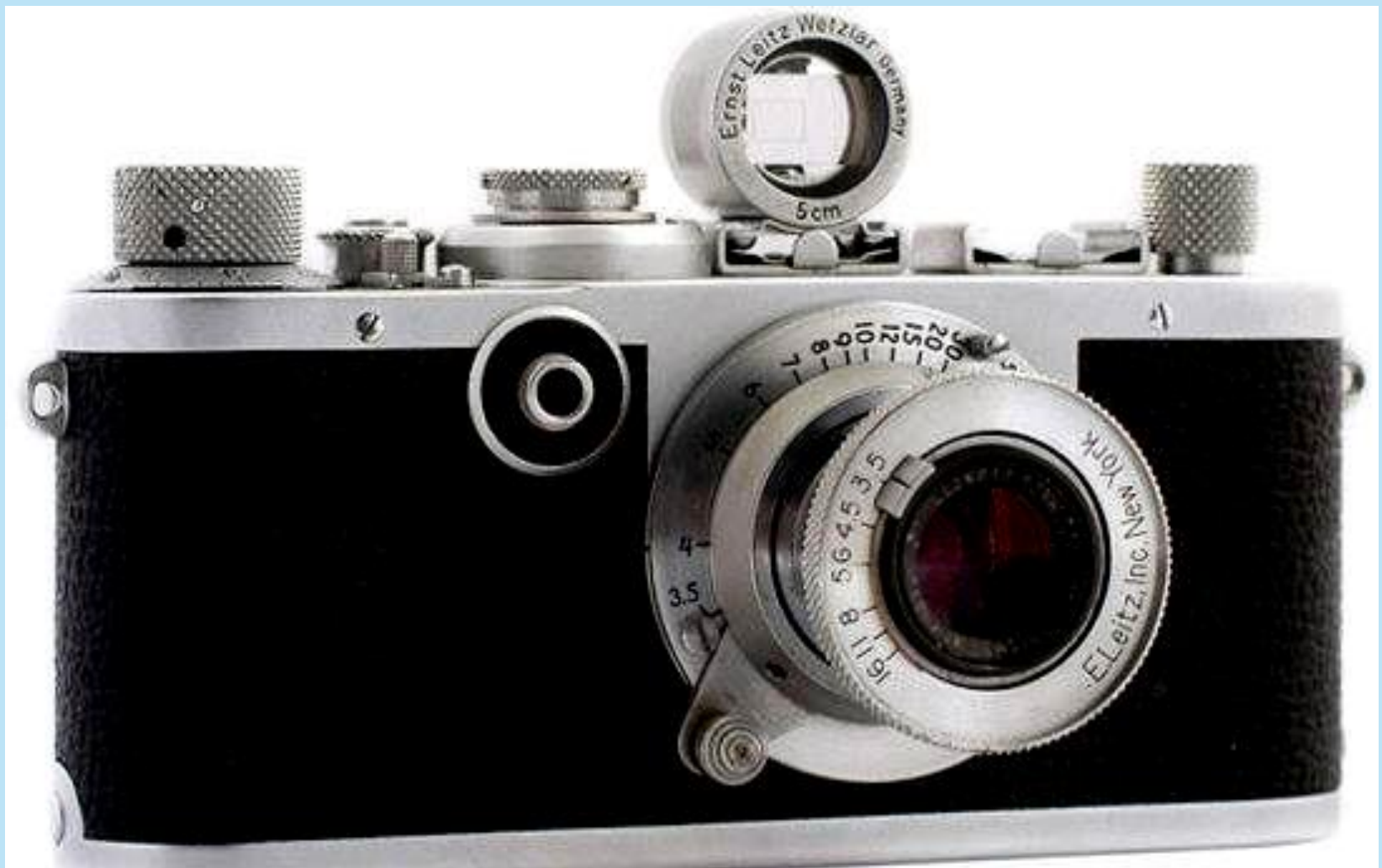
Historischer Fotoapparat „Leika,“ in Wetzlar produziert